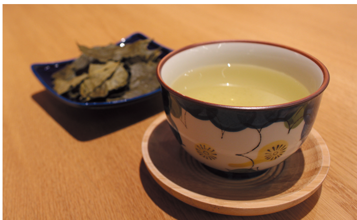
▲自然由来の肥料を使っているため、ミネラルも含まれています