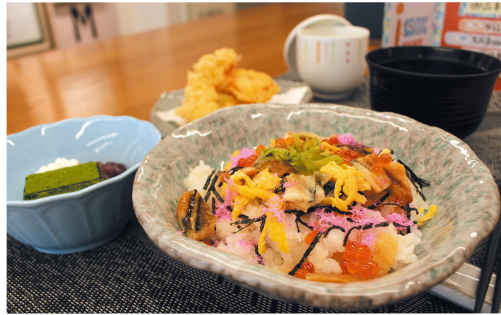
◀上の段が4月のお花見弁当、下の段が5月の端午の節句のお食事です