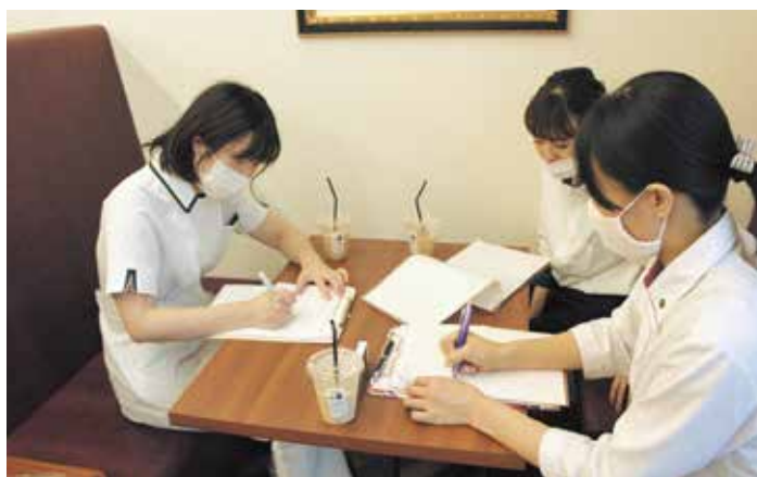
▲管理栄養士、看護師、言語聴覚士による打合せの様子

いつまでも元気でリズムタウン仙台でお過ごしいただくために連携を図りながらサポートしております。