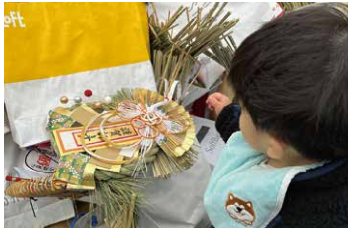
▲保育園の子どもたちも手伝ってくれました！

ちなみに、今年は十干十二支で癸卯（みずのとう）の年。「癸（みずのと）」は十干の一番最後に位置し、生命が一巡し次の新しい巡りへと移りゆく年とされています。また、漢書（中国の歴史書）によると、「卯」の字は草木が萌え出る様子を表します。そのことから、「癸卯」は 厳冬が去り春の兆しが訪れ、成長や飛躍へと向かう区切りの年となるといわれているそうです！