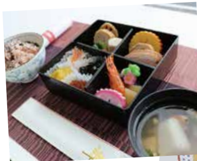
◀特製おせち & お雑煮です！

他にもお正月の風物詩「福笑い」を行いました。完成したそれぞれのお顔を見ると、どれもユニークで、温かな笑いに包まれました。「笑う門には福来る」ということわざがあるように、皆さまに福が訪れ、笑顔があふれ、それを見て周りにも福が来ますように。2023年もたくさん笑っていきましょう！