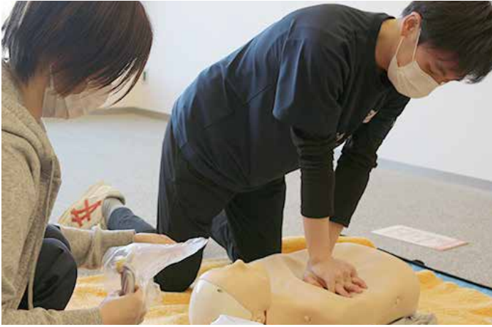
▲人形を使った実践練習も

ご利用者様が安心して日々をお過ごしいただけるように、みなさまの生活をサポートしていきたいと思っております。