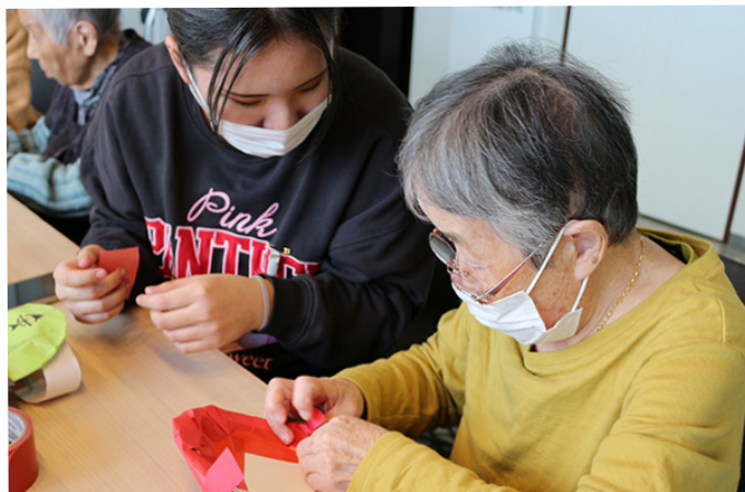
▲学生さんと一緒に鬼のお面を作りました

最初こそぎこちなかった作業やコミュニケーションもすぐに笑顔が増え、楽しいレクリエーションになったようです。