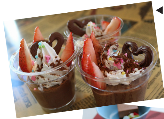
◀完成した チョコプリン

当日の特別ランチは、愛情たっぷりハート型のハンバーグが乗ったカレー。デザートにはチョコケーキが付きまして！リズムタウンでは愛が溢れた1日になりました。