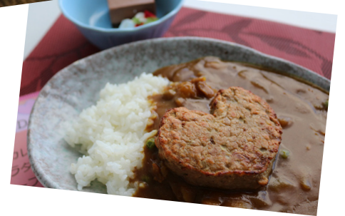
バレンタイン 特別ランチ▶