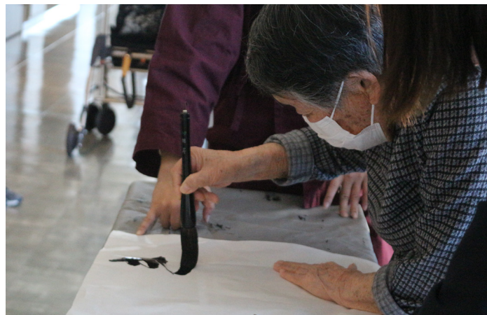
▲力強い一筆を披露いただきました

完成した作品は3月中にリズムタウン内に掲示いたしますので、ご来館の際はぜひご覧ください。