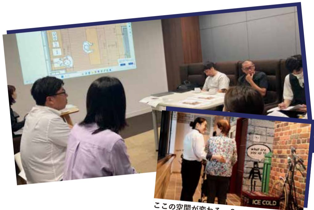
この空間が変わる...?

そこで、今回リノベーションを行う新しい空間は、ココナラ翼のファンで居てくださったゲストの皆様のためのおかげさまの空間にしよう！と考え、建築デザインのFHAMS様と空間を創造しました。全体像は固まりつつあり、物品・機材な