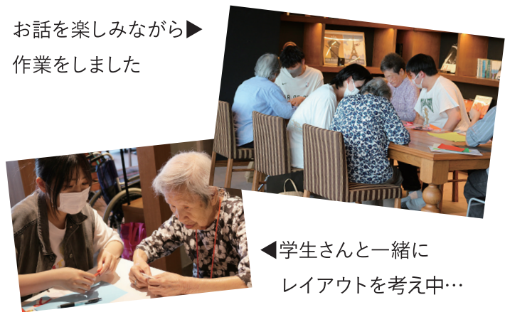
◀学生さんと一緒に レイアウトを考え中…