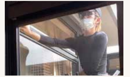
▲ ココナラの窓をクリーニング中

基弘会では法人スタッフと協力企業様などみんなの力を合わせて高いサービスクオリティの提供を目指しています。このコーナーはそんなご利用者様にとっての縁の下の力持ちを紹介します!