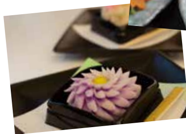
◀和菓子職人さんの手作り練り切り