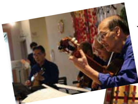
◀心落ち着くジャズの音色が会場に響き渡ります！

催しには、「タコスギターアンサンブル」さんの方に懐かしい歌謡メドレーを披露していただきました！思わず口ずさみたくなる懐かしい名曲が勢揃い！