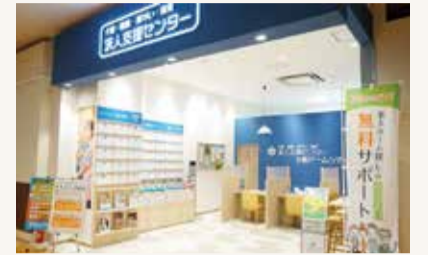
▲ 6月6日に株式会社FAN-CTIONが大阪ドームシティ4階に出店した「介護・看護・障がい・保育求人支援センター」

基弘会では法人スタッフと協力企業様などみんなの力を合わせて高いサービスクオリティの提供を目指しています。このコーナーはそんなご利用者様にとっての縁の下の力持ちを紹介いたします！